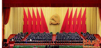
中国共产党第十八次全国代表大会

中国共产党第十八次全国代表大会于2012年11月8日至14日在北京召开。这次大会应出席代表2268人，特邀代表57人（共2325人）（出席开幕式的代表和特邀代表共2309人），代表了全党8200多万党员。